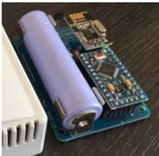
(위의 그림은 사용자의 이해를 위한 타사 제품의 이미지 입니다.)